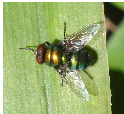
Patas que se agarran a cualquier superficie