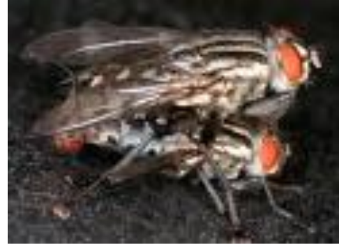
Apareamiento de la mosca doméstica