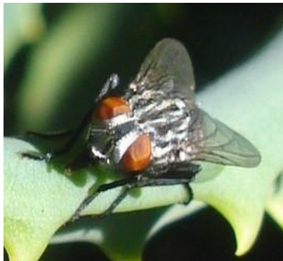
Ojos compuestos con multivisión