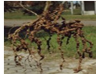
Quistes de nemátodos